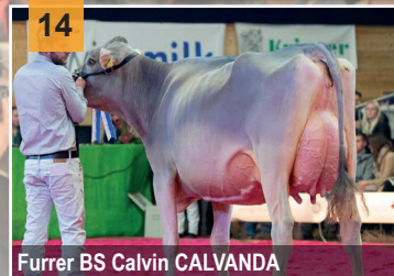
Furrer BS Calvin CALVANDA