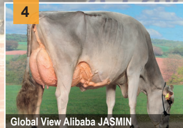
Global View Alibaba JASMIN