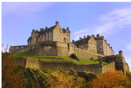
Die Burg «Edinburgh Castle» ist das Wahrzeichen von Edinburgh

Anmelden: möglichst schnell, jedoch spätestens bis 10. September 2017